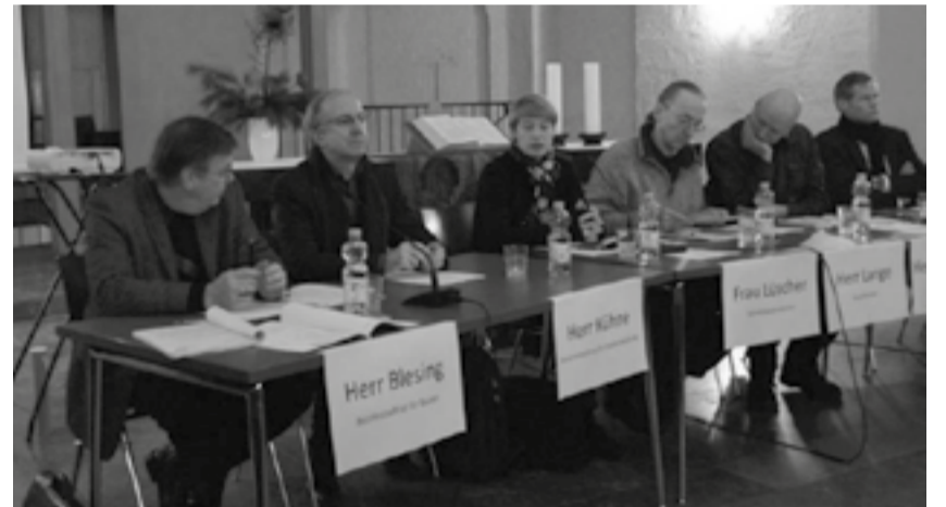
Informationen aus erster Hand erhielten die Besucher der Bewohnerversammlung am 1. Dezember in der Genezarethkirche

Ein weiterer Diskussionspunkt war die geplante Internationale Gartenbauausstellung (IGA), die ab 2017 auf dem Tempelhofer Feld