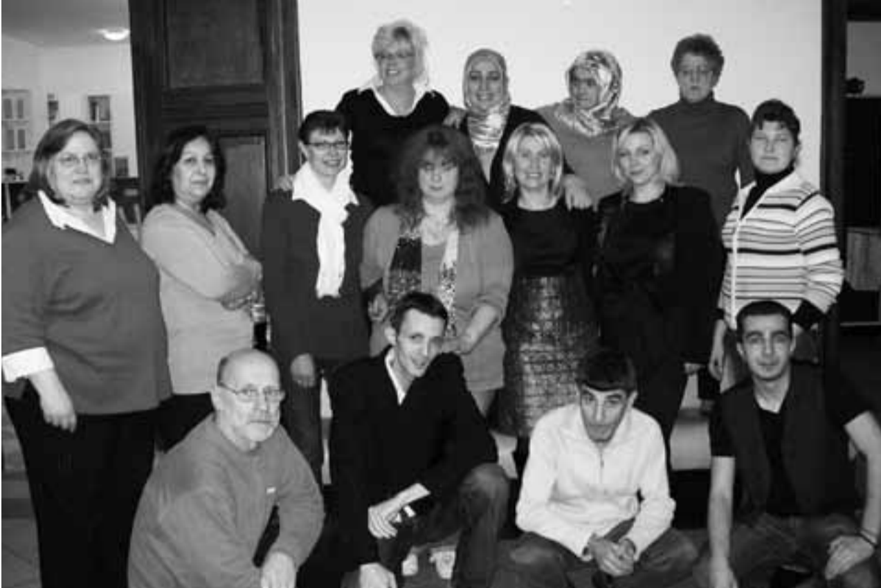
Das internationale Team des Nachbarschaftstreffs Warthe-Mahl

Der Schillerkiez in Neukölln ist bekannt für die Vielfalt der Nationalitäten seiner Anwohner und die ebenso unterschiedlichen Kulturen.