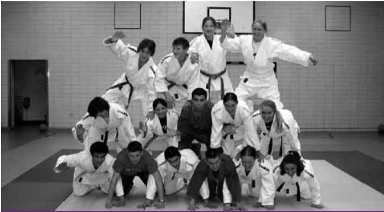
Die Judo-Familie des EBJC als Pyramide

Sportler jeden Alters aus dem Schillerkiez nutzen können.