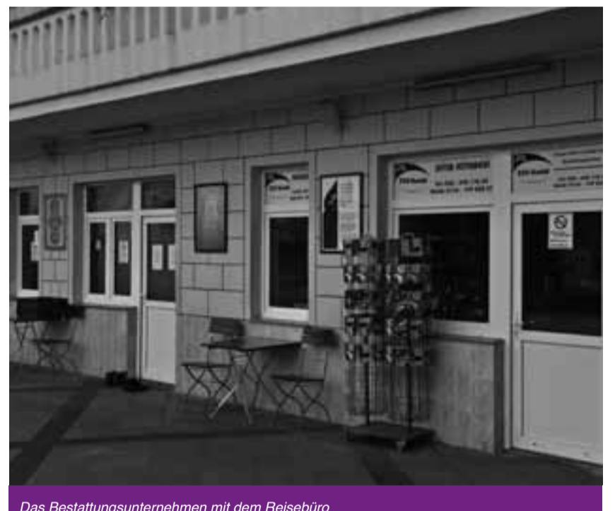
Das Bestattungsunternehmen mit dem Reisebüro

Die Moschee dient den Muslimen der angrenzenden Ortsteile, vor allem Neukölln und Kreuzberg in erster Linie als Gebetsstätte. Daneben finden in der Moschee auch die meisten Begräbnisze-