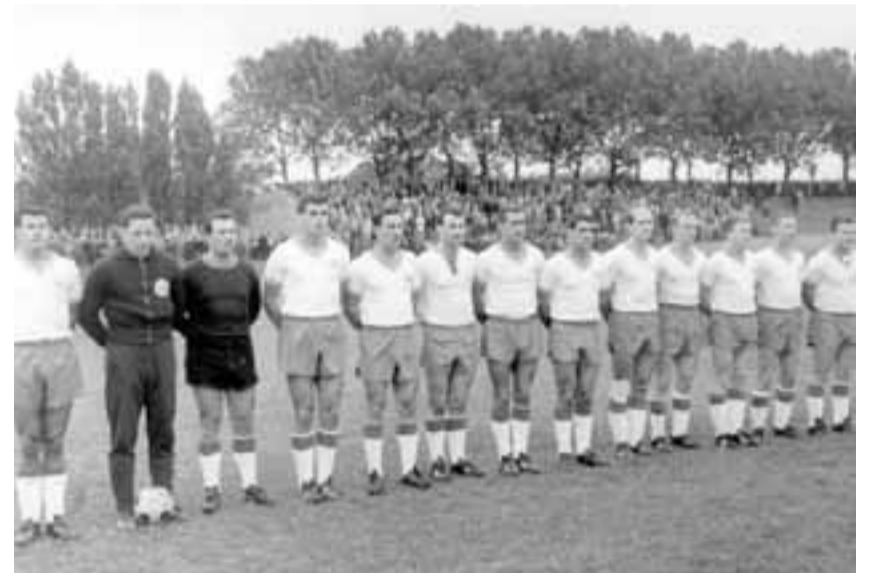
Die Tasmania-Elf im Juli 1965

der NOFV-Regionalliga betreiben, nicht machbar. Die Leistungsmannschaften profitieren zwar überwiegend - aber auch die „kleinen“ Bereiche (Minis – D-Jugend) erhalten jede Saison kräftige Unterstützung. Pro Saison „erwirtschaftet“ der Jugendförderkreis nennenswerte Beträge, um dann für jede Saison ca. 100 neue Trainingsbälle und 15 neue Spielbälle zu finanzieren. Zusätzlich werden immer wieder Spieler mit kostenlosen Sportmaterialien unterstützt. Achim Amann, Beisitzer im Vorstand, begründet diese ungewöhnliche Förderung: „Wir möchten auch Kindern- und Jugendlichen aus weniger gut betuchten Familien die Chance bie-