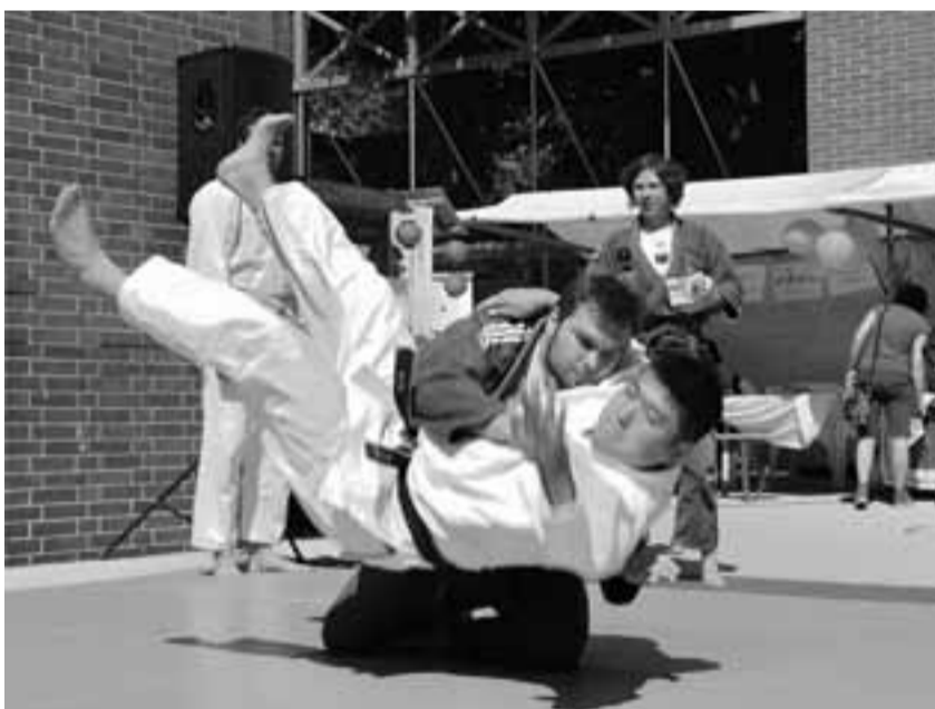
Judo-Vorfürungen auf dem Markt der Vielfalt

Der Markt der Vielfalt auf dem Herrfurthplatz bot dem EBJC eine weitere Gelegenheit, sich der Öffentlichkeit mit seinem Angebot zu präsentieren. Dass zum Judo neben dem Sport auch Respekt, Fairness und eine würdevolle Haltung gehören verstand das Publikum sehr gut. Beide Demonstrationen wurden mit viel Applaus bedacht und von den Veranstaltern als Höhepunkte des gesamten Bühnenprogramms bezeichnet. CHRISTOPH MENNE