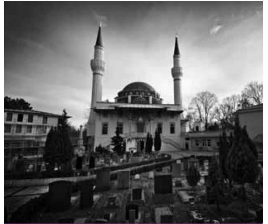
Die Şehitlik-Moschee mit dem Türkischen Friedhof

an. Von hier aus werden weltweit Flüge mit türkischen Fluglinien arrangiert. „Aber“, so versicherte ein Mitarbeiter, „natürlich können auch alle nichttürkischen Mitbürger Flugreisen buchen. Allerdings