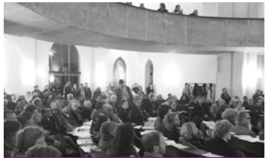
Sogar auf die Empore der Kirche mussten einige Gäste ausweichen

Dass eine solche Veranstaltung dringend nötig war, zeigten die zahlreichen Fragen, die in der vom Quartiersrat des QM Schillerkiez organisierten Diskussion gestellt wurden. Dabei wurde auch deutlich, dass es viele Gerüchte und Unklarheiten gibt. Die allgemeinen Planungen seien noch nicht abgeschlossen und würden auch noch einige Zeit in Anspruch nehmen, sagte Senatsbaudirektorin Regula Lüscher von der Senatsverwaltung für Stadtentwicklung. Erste Voraussetzung sei eine Änderung des Flächennutzungsplanes. Im Anschluss daran beginne die Diskussion. „Der geplante Park soll ein öffentlicher Park bleiben“, betonte sie und forderte ihre