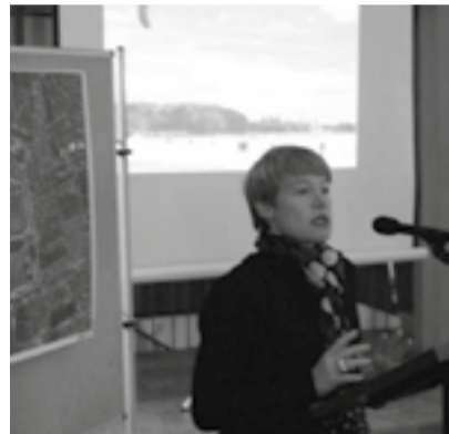
Städtebaudirektorin Regula Lüscher informiert die Anwohner über die Pläne zum Tempelhofer Flugfeld.

Ein neues Wohngebiet, Erschließungsstraßen, die Internationale Gartenbauausstellung auf dem Tempelhofer Flugfeld. Der Senat hat viel vor mit der Freifläche im Westen des Schillerkieses. Welche Auswirkungen dies auf das Quartier haben, könnte, erfuhren Interessierte am 1. Dezember auf einer Bewohnerversammlung in der Genezarethkirche direkt von den politisch Verantwortlichen. Knapp 200 Gäste waren gekommen, um sich über den aktuellen Planungsstand zu informieren und