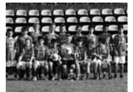
Die jungen Fußballer präsentieren stolz den Pokal

Mit der MyTas Plattform sorgte der Verein in den Medien für erhöhte Aufmerksamkeit. Alle registrierten Nutzer erhalten Infos zur Trainingsbeteiligung, Trainingsnoten und vergangene Spielnoten - alles vom Trainerteam bereitgestellt. Anhand dieser Infos kann die Aufstellung „gevotet“ werden. Die Nutzer dieses Forums stehen so in direktem Kontakt zum Trainerteam und können bei der Aufstellung der Mannschaft mitentscheiden. CHRISTOPH MENNE